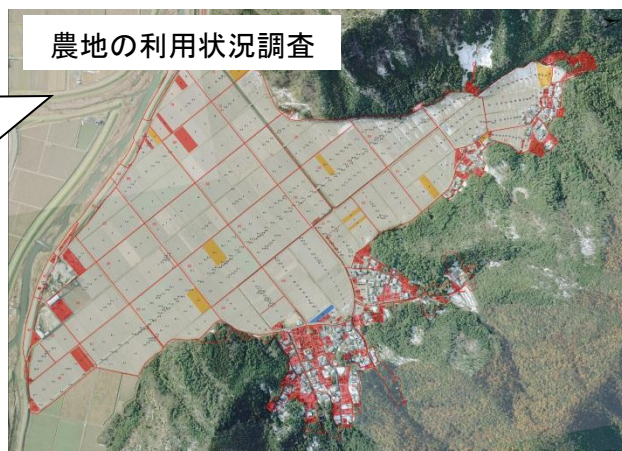
農地の利用状況調査

地図上で所在と耕作者の把握が容易に行えることから、規模拡大等の検討をスムーズに行うことが可能。