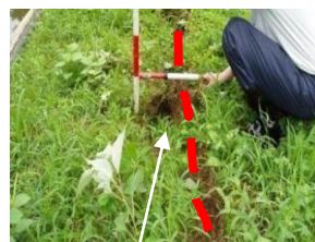
堤の亀裂箇所の測定